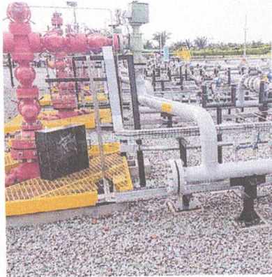
Estação de Gás Natural Gavião Branco, da Eneva, no Maranhão

Inicialmente, os setores de mineração, metalurgia, papel e celulose serão a prioridade na prospecção da Eneva. Como a operação vai começar em regiões que não estão conectadas à malha de gasodutos, a empresa pretende adotar o mesmo modelo que implementou no projeto termelétrico de Jaguaretica II, em Roraima: o abastecimento por meio de GNL. O transporte será feito por modal rodoviário ou hidroviário.