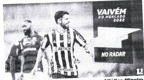
Diego Costa rescindiu contrato com o Atlético Mineiro

Os valores apresentados pela diretoria corinthiana não são surreais, ainda que seja um dos mais altos no comparativo com o elenco, mas inicialmente as cifras não foram vistas como empecilho para a negociação